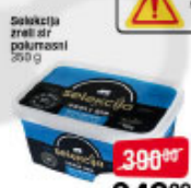
Selektija 2% m.š. polutvrdi 250 g