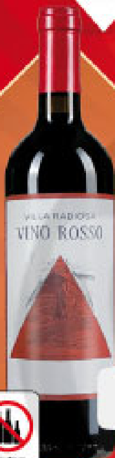
Villa Radosa crveno vino 750 ml