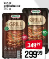
Yuhar grill kobasice 250 g