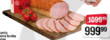
Carnex svinjska pečenica kg