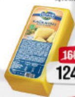
Biser kačkavalj 45% m.š.m. kg