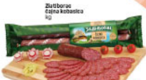
Zlatiborac čajna kobasica kg