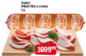
Yuhar Pileći file u crovu kg