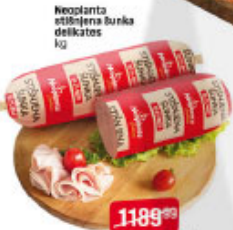
Neoplanta svinjska bunka delikates kg