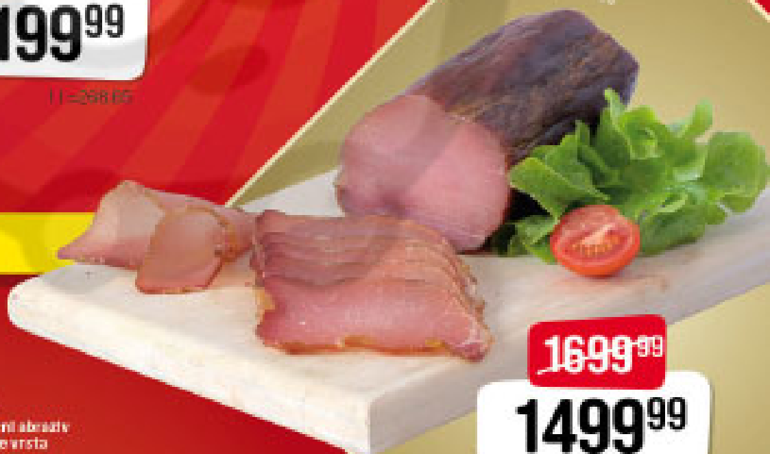
Selektija trilogijska suva pečurica 1g