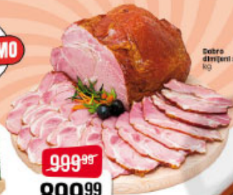
Dobro dimljeni svinjski vrut kg