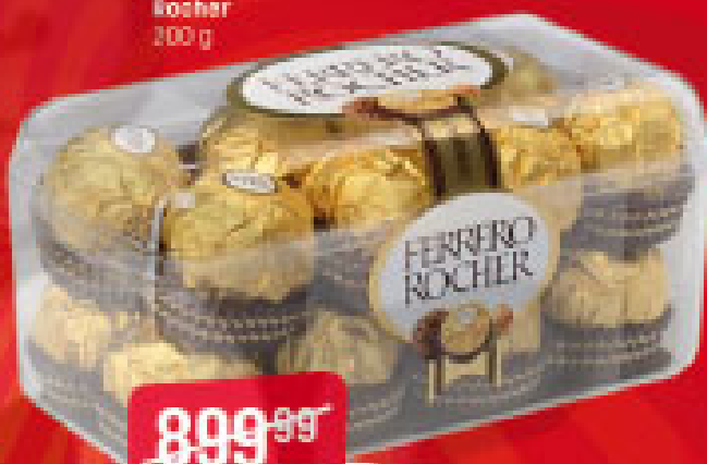
Ferrero Rocher 200 g

OPREZNA POUČILA: Održivi izbori. Održivo konzumiranje alkohola može biti štetno za zdravlje.