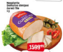
Neoplanta Delikates dimljeni čureći file kg