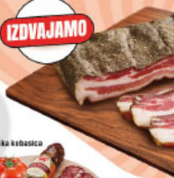
Topola izletnička kobasica kg