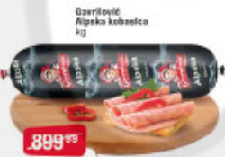
Gazrilović šipska kobasica kg