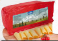
Dobro Edeño kg