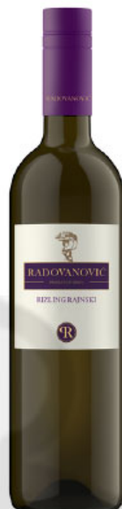
Vinarija Radovanović Rizling 0,75 l art. 46558