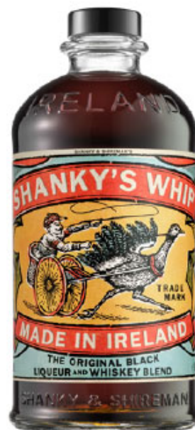
Shankys Viski 0,7 l art. 72045