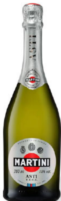
Martini Asti 0,75 l art. 330280